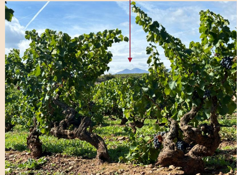
Cabezaparda 2106 m

Cabezaparda es la cima que se alza junto al San Lorenzo, el pico más alto de La Rioja . Es el lugar por el que todo el mundo pregunta el nombre. El sitio que despierta la curiosidad. Y del que ya nunca te vas a olvidar.