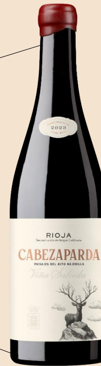
TINTO ALTO NAJERILLA