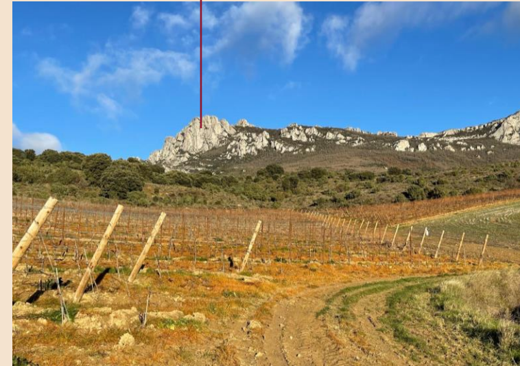
Pico Palomares 1446 m

Es la cumbre que domina la Sonsierra, la cima que marca el horizonte de una de las tierras más emblemáticas de Rioja. Es el punto más alto, el lugar al que se mira cuando se busca referencia, cuando se quiere entender el paisaje. Su presencia impone, pero sobre todo inspira.